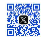
公式X (旧Twitter) @wayo_unv