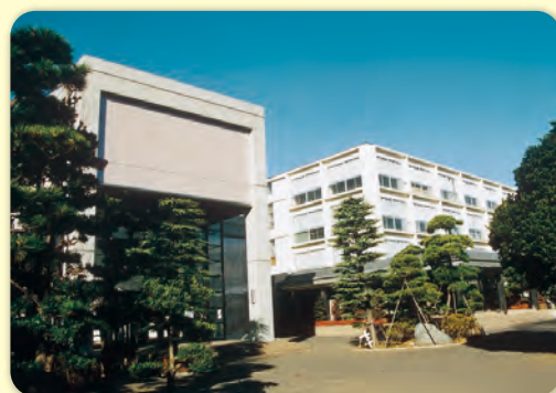
昭和学院短期大学コース