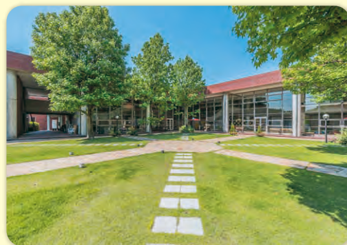
環太平洋大学コース