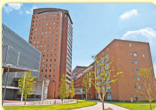
和洋女子大学コース