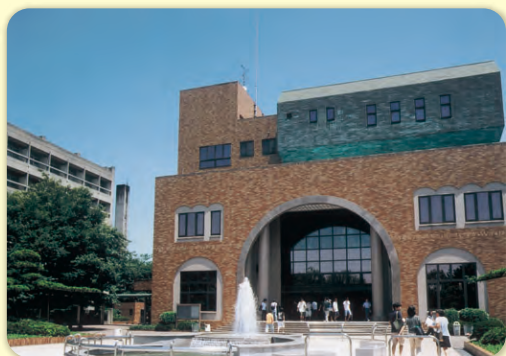
千葉商科大学コース