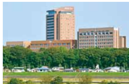
江戸川の向こうから臨む 和洋女子大学